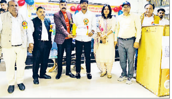
भिवानी। स्वयंसेवकों को सम्मानित करते डीएसपी व कॉलेज स्टाफ।