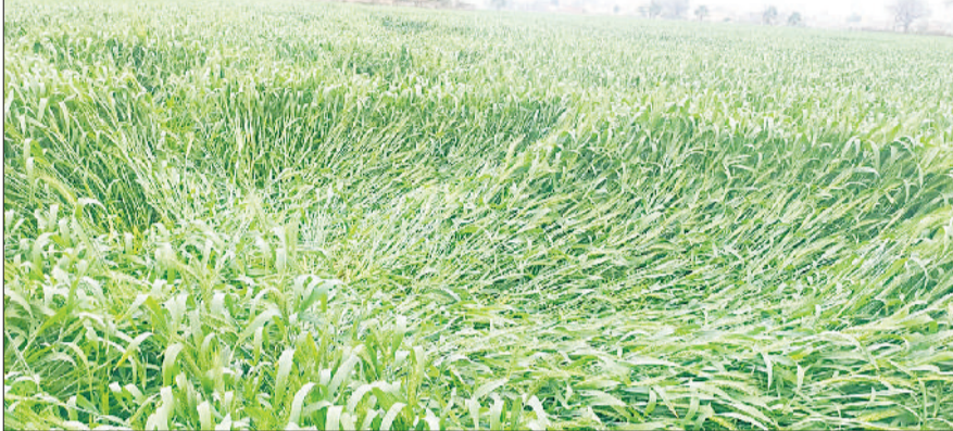
मिवाणी। बरसात के साथ तेज हवा चलने से बिछी गेहूं की फसल।

बुधवार को एकदम मौसम का मिजाज बदल गया। कहीं हल्की बूंदाबांदी हुई तो अनेक जगहों पर हल्की ओलावृष्टि ने किसान की हार्ट बीट तेज कर दी। हालांकि ज्यादा देर तक ओलावृष्टि नहीं हुई, लेकिन ओलावृष्टि से सरसों की फसलों में नुकसान होने की आशंका है। वहीं बारिश के साथ तेज हवा चलने से कई जगहों पर गेहूं की अगेती फसल भी जमीन पर बिछ गई, जिससे फसल की औसतन पैदावार में कमी आने की पूरी पूरी संभावना है। फिलहाल बदले मौसम के मिजाज की वजह से किसानों की चिंता बढ़ गई।