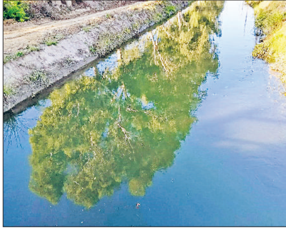
भिवानी। जुई फीडर में बहता पानी।

इस बार किसानों को नहरी पानी की जबरदस्त किल्लत झेलनी पड़ेगी, क्योंकि सिंचाई विभाग की डिमांड के अनुसार पानी नहीं मिलने से बनी समस्या के बाद एक के बाद एक नहर को बंद किया जा रहा है। नहरी पानी कम मिलने से सुंदर ग्रुप की नहरों में एक साथ पूरा पानी नहीं बह सका। सिंचाई विभाग ने सुंदर ग्रुप की नहरों के लिए 22 सौ क्यूसेक पानी की मांग भेजी थी, लेकिन पीछे से महज 1309 क्यूसेक ही पानी मिल पाया था, जो डिमांड से 900 क्यूसेक कम था, जिसके चलते सिंचाई विभाग को मजबूरन जुई फीडर व निगाना फीडर को बंद करना पड़ा था। बुधवार को पानी की कमी के चलते अब सुंदर डिस्ट्रीब्यूटरी को भी बंद कर दिया गया है और जुई फीडर में पानी छोड़ा गया है। उल्लेखनीय है कि ये माह किसान व शहरवासियों के लिए बड़ा परेशानी का है। 14 फरवरी