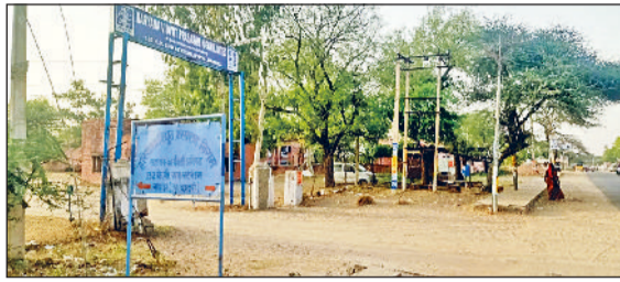
मिवानी। बाढ़डा उपमंडल का बिजली आपूर्ति कार्यालय।