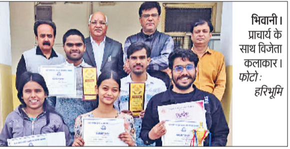
भिवानी। प्राचार्य के साथ विजेता कलाकार।