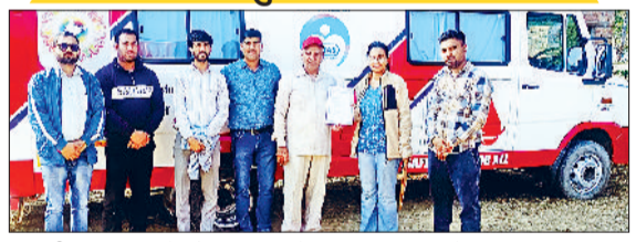
भिवानी। रक्तदाताओं को प्रमाण पत्र देकर सम्मानित करते अतिथि।