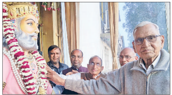
भिवानी। महाराजा अग्रसेन की प्रतिमा पर माल्यार्पण करते अतिथि।