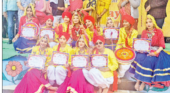
भिवानी। प्रतिभागियों को सम्मानित करते अतिथि।